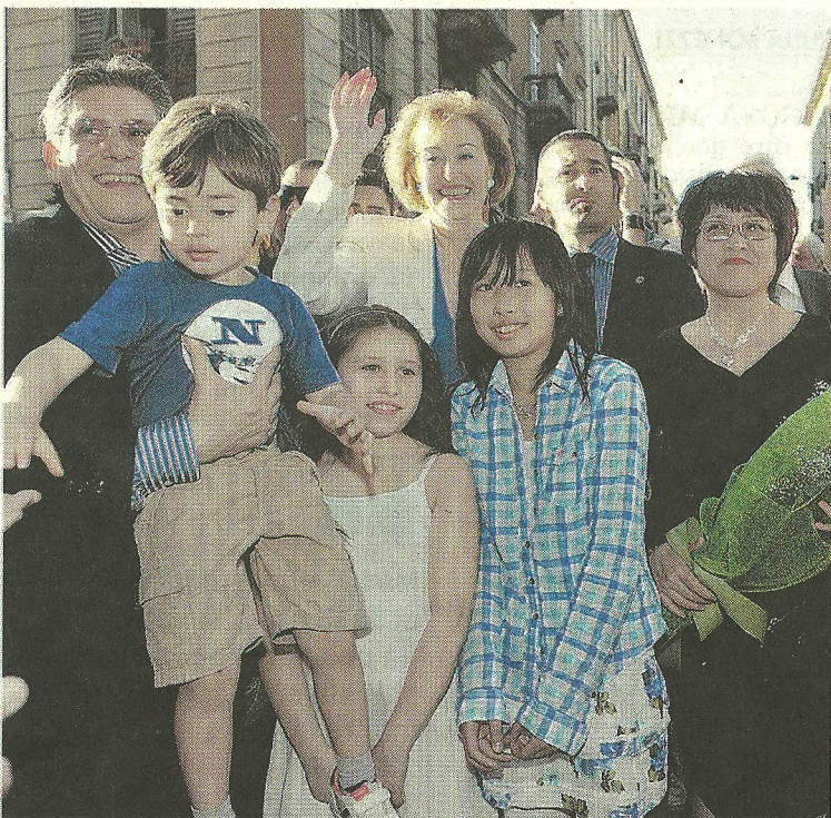
SORRISI Il sindaco Letizia Moratti tra residenti italiani e cinesi all'inaugurazione della nuova isola pedonale di via Paolo Sarpi